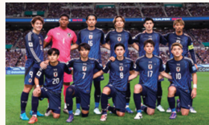
AFCアジア予選 対オーストラリア代表戦 先発メンバー (2024.10.15)